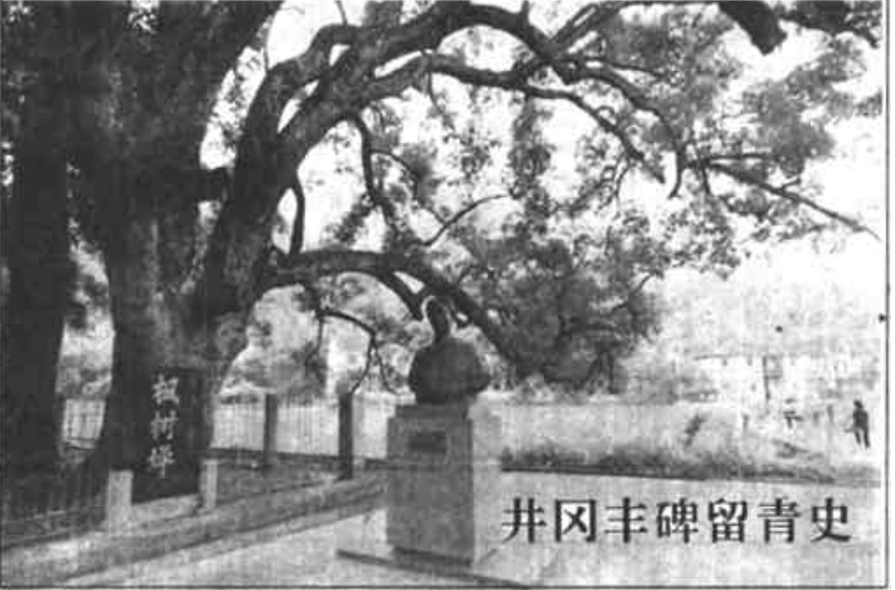
井冈山丰碑留青史

新华社南昌6月8日电(记者 刘菁)江西省劳动部门日前宣布,现阶段将首先在非公有制企业和建立现代企业制度的企业推行工资集体协商制度。工资集体协商制度是深化企业工资制度改革的一项重要内容。按照工资集体协商制度,企业职工代表可与企业代表就企业内部工资分配制度、工资分配形式、工资标准、奖金分配办法等进行平等协商,在协商一致的基础上双方签订工资协议。实行这项制度,可以消除企业工资分配、工资水平确定的随意性,保护职工合法权益。目前,江西只有少数企业试行工资集体协商制度。江西省劳动和社会保障厅日前决定,重点在非公有制企业和建立现代企业制度的企业推开这项工资集体协商制度,其他企业可根据自身情况积极试行。已订立集体合同的企业,可将工资协议作为集体合同的附件;目前尚未订立集体合同的企业,可一并签订或单独签订专项工资协议。