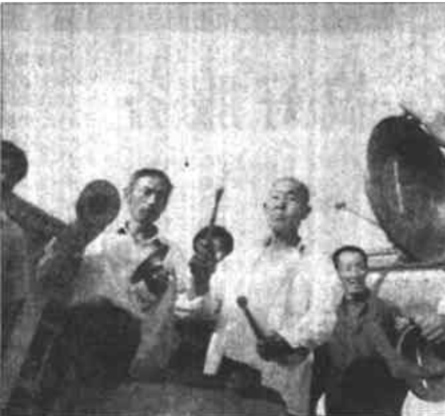
在中国共产党成立八十周年之际，东营区牛庄镇牛庄村的老党员们在党员活动室，敲起锣鼓来抒发他们对党的热爱之情。