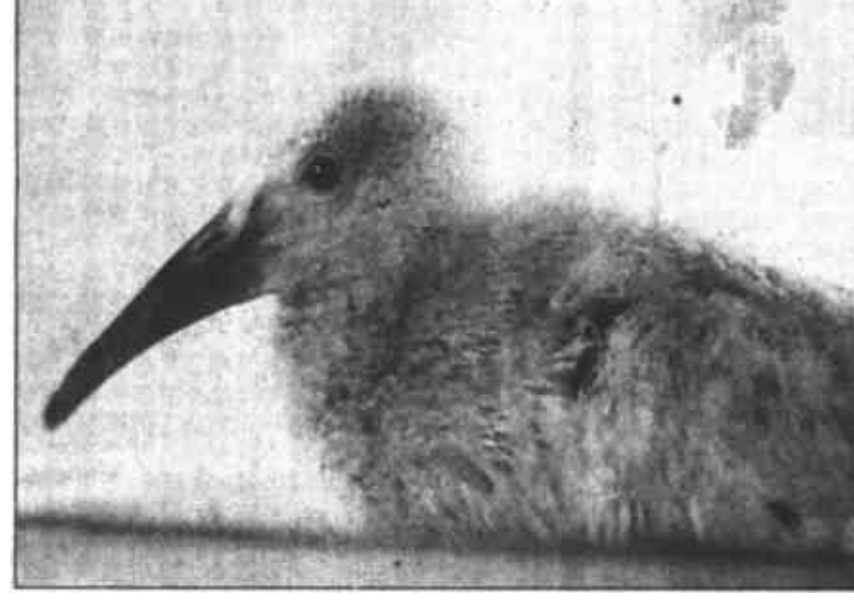
一只体重为51.6克的小朱鹮6月4日在陕西朱鹮救护饲养中心育雏箱里顺利出壳,使我国今年人工和野外繁殖朱鹮数已达94只,创历史最高纪录。至此,我国朱鹮的种群数量已由1981年发现朱鹮时的7只增加到现在的312只。图为4月8日人工繁殖出的今年第一只小朱鹮,它已长满羽毛。

据新华社石家庄6月7日电(记者 杨守勇)过去一直靠我国西部地区露地生产的蜜瓜,如今通过技术人员的努力,已成功地实现了东部种植,成为华北地区高效农业的典型。